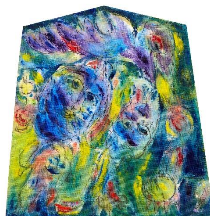
Et udvalg af Carl-Henning Pedersens skitser til udsmykningen af Frihedsmuseet. Skitserne tilhører Carl-Henning Pedersen & Else Alfelts Museum