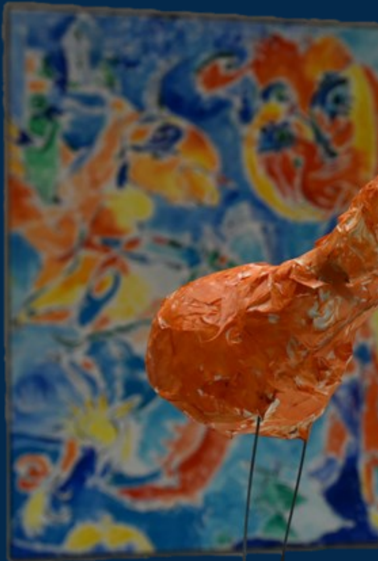
Fantasifugleskulptur produceret af elev med inspiration fra Carl-Henning Pedersen i åben skole-forløbet FUGL- FAKTA OG FANTASI forår 2018