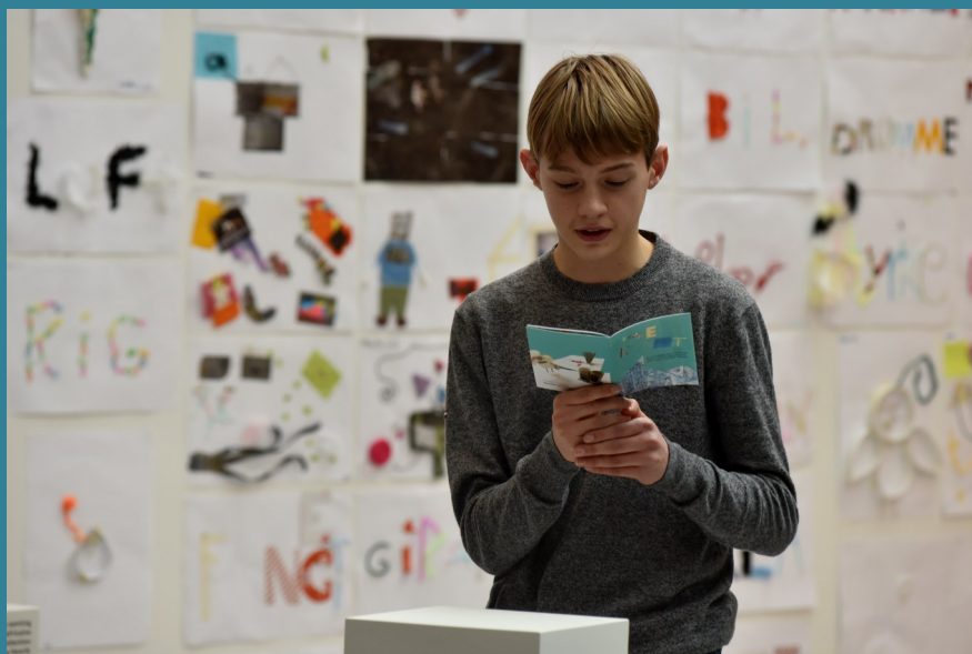
Elev læser sin egen fabel op for alle de fremmødte til udstillingen af elevernes egne værker på museet