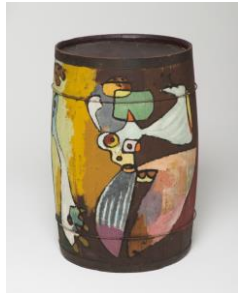
Asger Jorn (1914-1973) Uden titel, 1941 NSU Art Museum Fort Lauderdale