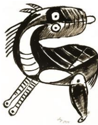
Carl-Henning Pedersen (1913-2007) Helhesten, 1943 Carl-Henning Pedersen & Else Alfelts Museum