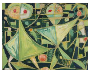
Egill Jacobsen Græshoppedans, ca. 1941 KUNSTEN Museum of Modern Art, Aalborg