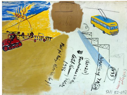
Carl-Henning Pedersen Fantasiens verden , 1946 Bagside