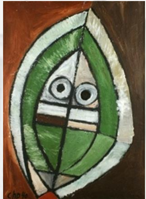
Carl-Henning Pedersen, Maske , 1940

Carl-Henning Pedersen er ofte blevet kaldt fantasiens maler . Som de andre kunstnere i Helhesten fandt han stor inspiration i fantasiens verden. Fugle, drømmeslotte, stjerner og svævende skibe er blandt Pedersens favoritmotiver. Pedersen fandt stor inspiration i børns tegninger, og han har fortalt, at han synes, børn er de klogeste mennesker. Han mente, at børn havde en særlig evne til at bruge deres fantasi i alt, hvad de foretager sig. Den abstrakte kunst som Pedersen og de andre kunstnere i Helhesten malede, foreslog han, at man i stedet skulle kalde fantasikunst . Han mente, at alle mennesker med det samme vil forstå, hvad fantasikunst er. At kalde kunsten for abstrakt vil derimod få folk til at tro, at kunstnerne havde opfundet noget helt nyt, helt uafhængigt af inspiration fra den primitive folkekunst og børns fantasitegninger. Helhestens kunst var ikke en slags kunst, folk skulle lære at forstå - den krævede ingen læring, blot at man ville bruge sin fantasi og de følelser, som ligger helt naturligt i alle mennesker.