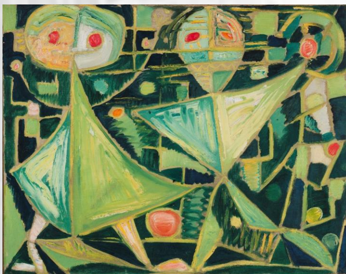
Egill Jacobsen, Græshoppedans , 1941