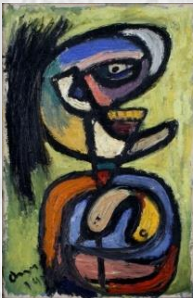
Asger Jorn, Figur , 1940