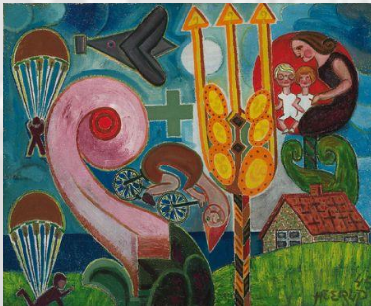
Henry Heerup, Krig og Fred , 1945