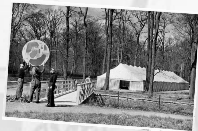
Foto af teltet i Dyrehaven, 1941

Udstillingen War Horses – Helhesten og den danske avantgarde under 2. verdenskrig sætter som den første museumsudstilling nogensinde fokus på Helhesten og gruppens legendariske teltudstilling, som er genopført på museet.