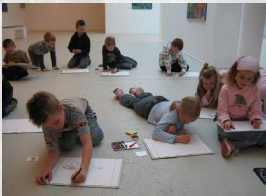
Elever på skolebesøg