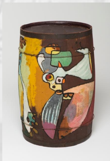
Asger Jorn, Uden titel , 1941