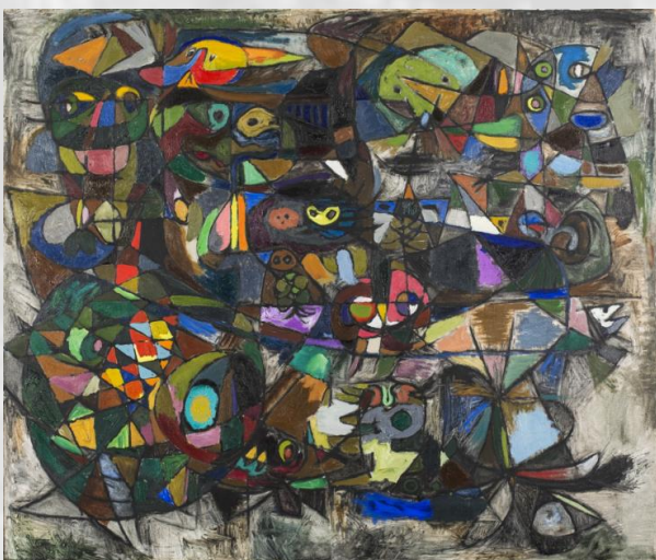
Asger Jorn, Småting , 1940

Inspirationen til værkernes motiver fandt Jorn gennem særlige teknikker. Han tegnede flere tegninger på gennemsigtigt papir, og lagde dem til sidst oven på hinanden. Det gennemsigtige papir gjorde, at tegningerne blandede sig til ét samlet motiv. Flyttede han på en af tegningerne, forandrede motivet sig. En anden teknik Jorn også brugte var automattegning, som han mente gjorde kunstværket mere spontant. Med denne teknik gjorde Jorn sig helt fri af at overveje værkets form inden han påførte malingen på lærredet. Helt automatisk lod han hånden nedfælde linjeforløb, og på den måde lod han kontrol og fornuft vige for det irrationelle og spontane udtryk. Jorns værk "Småting" fra 1940 er blevet til ud fra denne teknik. Værket kan opleves på museets udstilling.