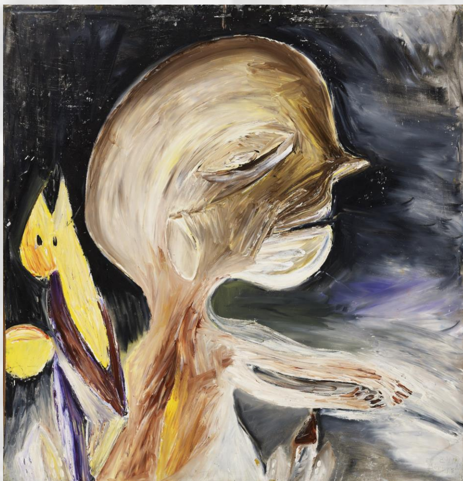
Carl-Henning Pedersen, Søvngænger , 1943