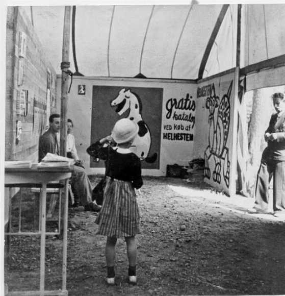
Foto fra udstillingen 13 kunstnere i et Telt , 1941

Kunstnerkollektivet Helhesten eksisterede i årene under 2. verdenskrig og repræsenterede nogle af landets førende modernistiske kunstnere, blandt andre Asger Jorn, Carl-Henning Pedersen, Else Alfelt, Ejler Bille, Henry Heerup (1907-1993) og Egill Jacobsen. Foruden billedkunstnere inkluderede gruppen også digtere, arkæologer og psykologer. I fællesskab udgav gruppen tidsskriftet Helhesten , som bød på essays om kunstteori samt artikler om ikke-vestlige artefakter, digtning, moderne film, arkitektur og sågar tatoverings-kunst samt kunstnerportrætter, som kunstnerne skrev om hinanden. Tidsskriftet blev sendt ud til mere end tusinde danske hjem og institutioner.