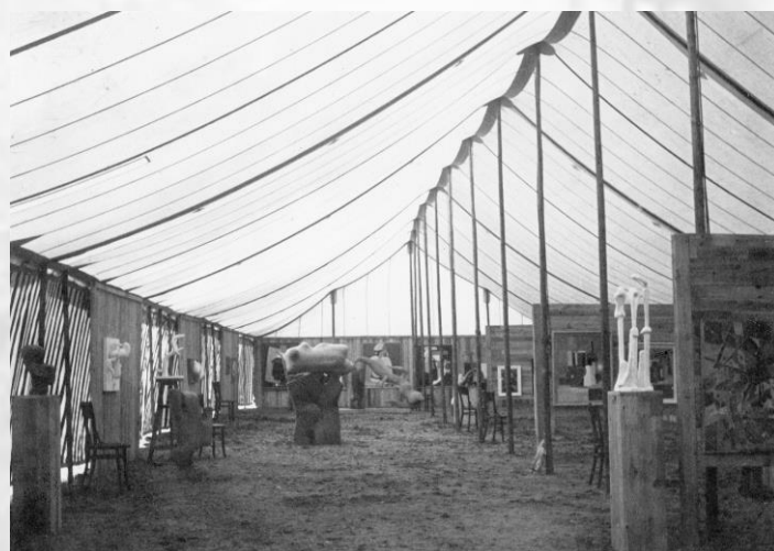
Foto fra udstillingen 13 kunstnere i et Telt , 1941