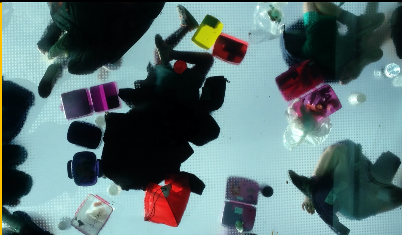
Elever spiser madpakker på toppen af Ovenlyssalen