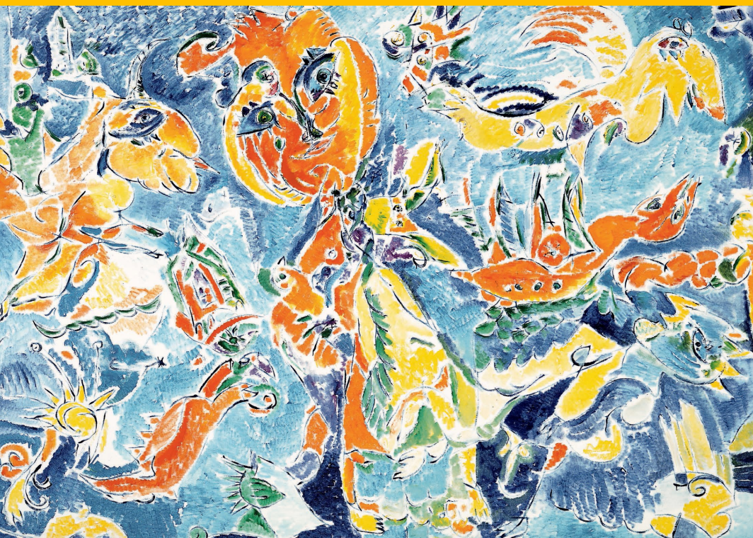
Carl-Henning Pedersen, Sommerens sødme, 1985