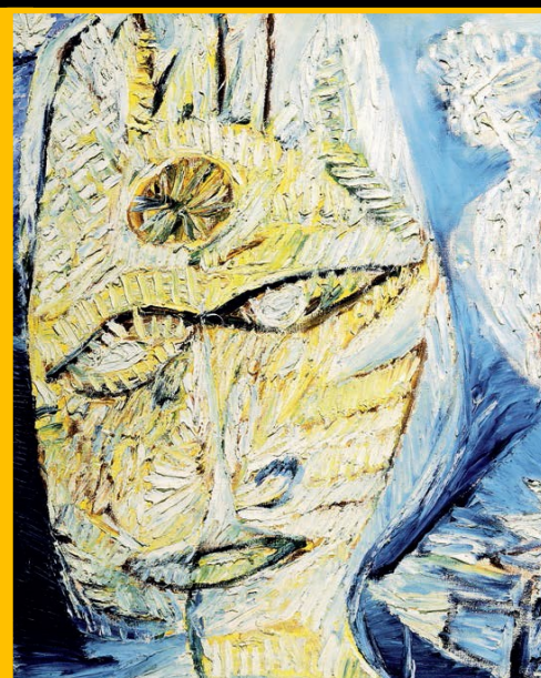
Carl-Henning Pedersen, Drømmen , 1947

Forløbet kan eventuelt tilpasses til billedkunst i indskolingen.