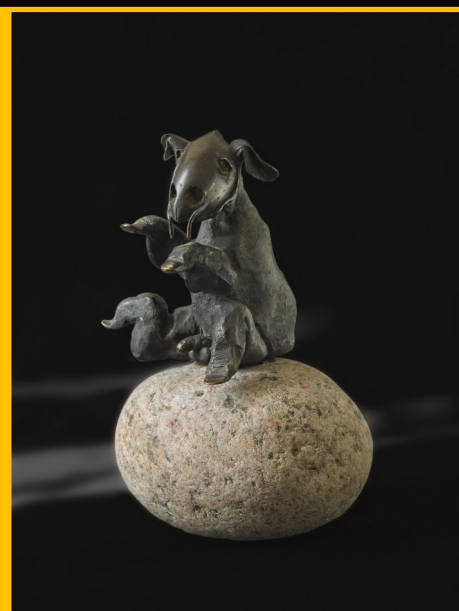
H.K.H. Prins Henrik, Fabeldyr , 1970-1980

Fremstilling: Eleven kan udarbejde enkle tekster med billeder og skrift og Eleven kan præsentere sit produkt i nære sammenhænge