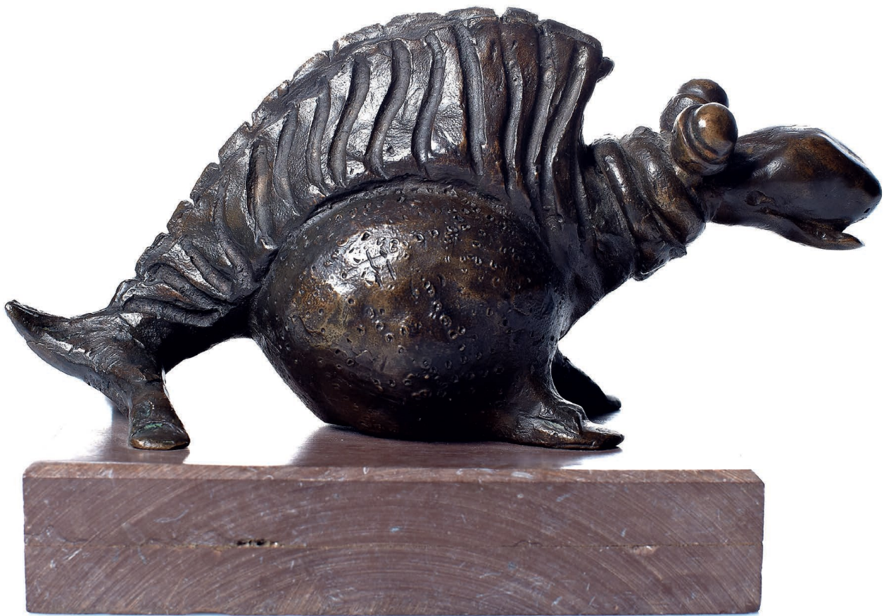
H.K.H Prins Henrik, Fabeldyr; Dragen, 1970-1980